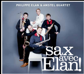
2015 Sax Avec Elan!