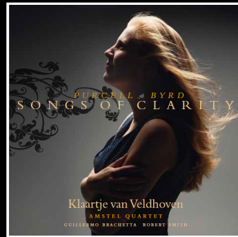
2014 Songs of Clarity