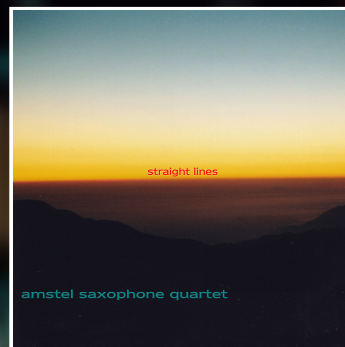
2002 Straight Lines