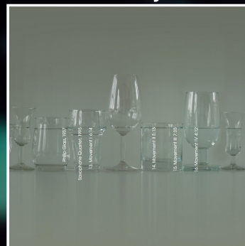
2007 Amstel Peijl