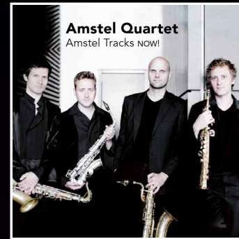
2012 Amstel Tracks NOW!