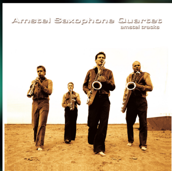
2004 Amstel Tracks