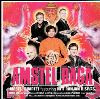
2011 Amstel Raga