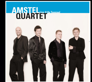
2011 Live @ the Toonzaal